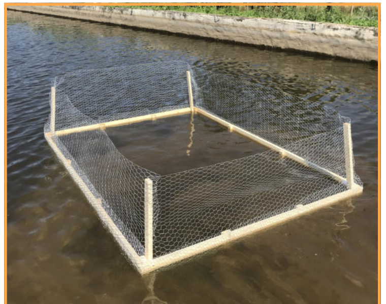
Nouvel exclos de 2019

Cette production de fruit et cette grande colonisation permet d'être optimiste quant à la sauvegarde de cette espèce patrimoniale, dont les espoirs de conservation régionaux reposent sur cette unique population. Des aménagements en faveur de sa conservation et des suivis seront menés dans les années à venir.